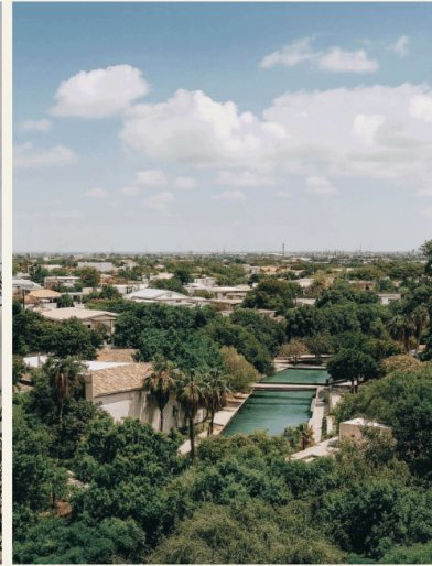
VISTA DEL PASEO SANTA LUCÍA DESDE NIDO SANTA LUCÍA