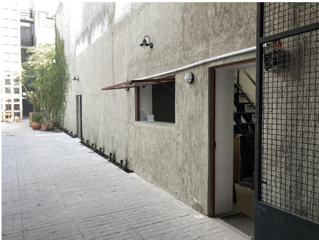
ARBOTANTES SOBRE CASETA Y ESPACIO DE RECICLAJE