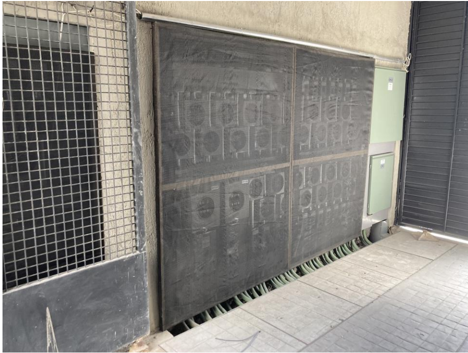
PROTECCIÓN TEMPORAL REGISTROS MEDIDORES CFE