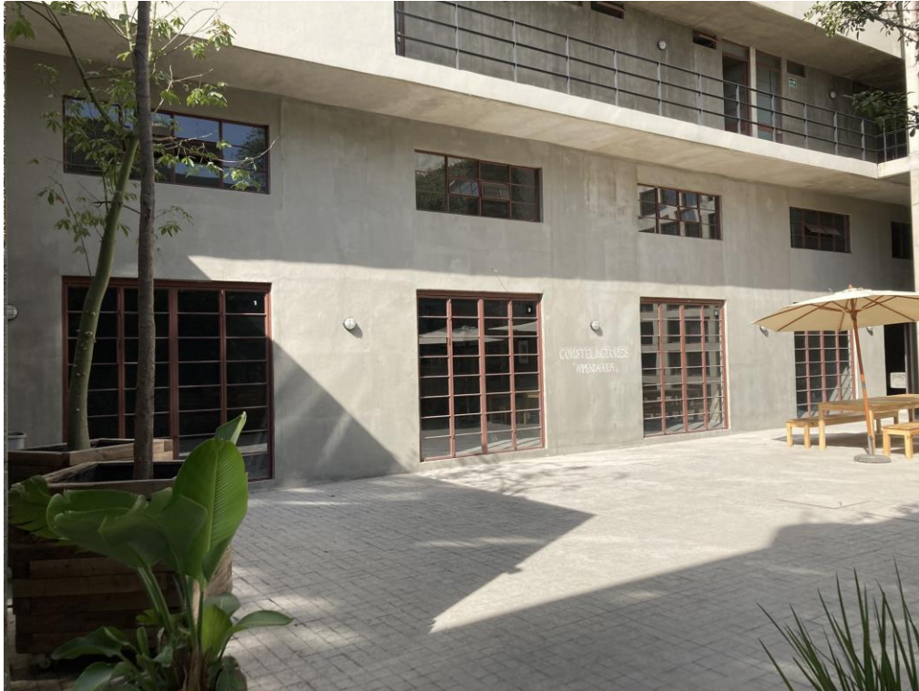
SEÑALÉTICA Y ENTREGA L1, L2, L3 Y L4