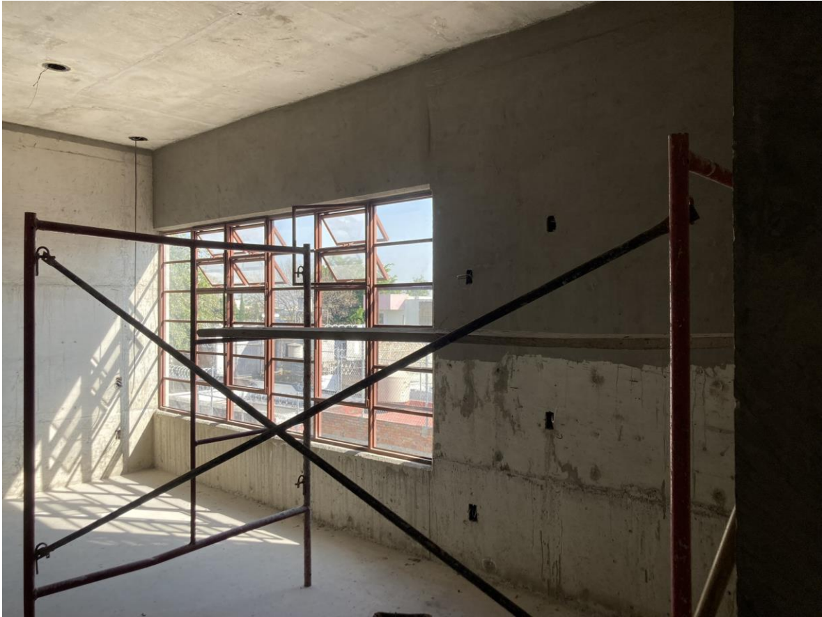
ACABADO MUROS DEPARTAMENTO 112