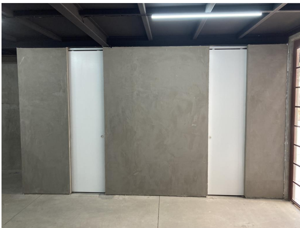
ACABADO MUROS L7