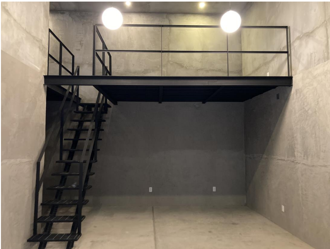
SEÑALÉTICA Y ENTREGA L5