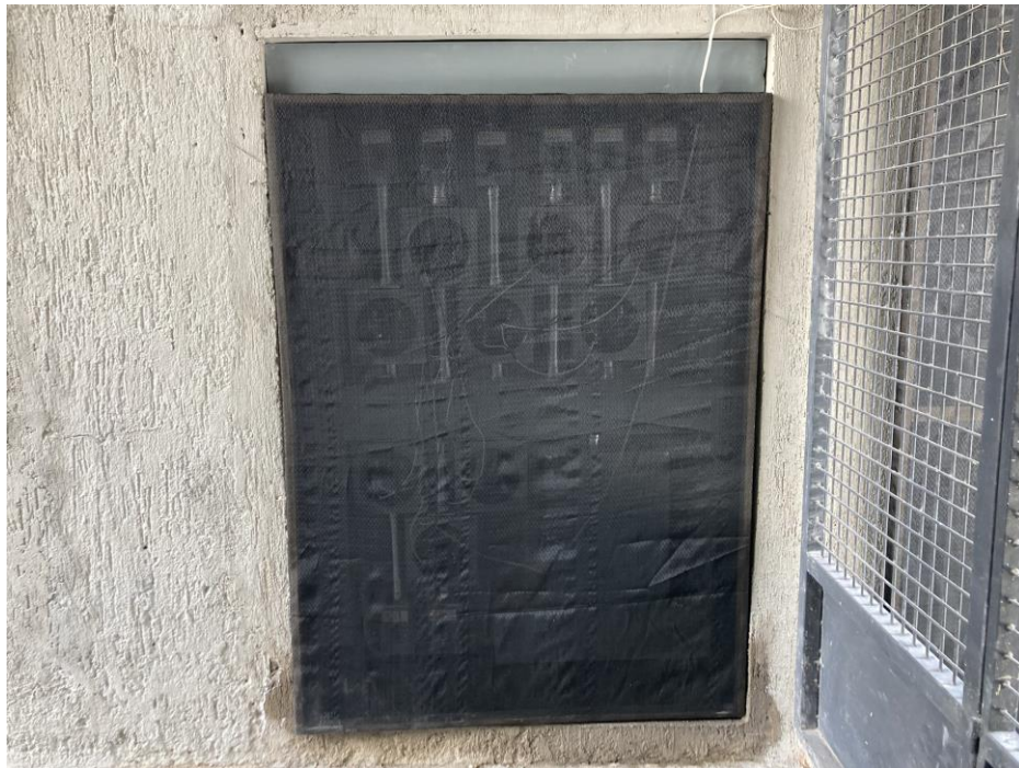
PROTECCIÓN TEMPORAL REGISTROS MEDIDORES CFE