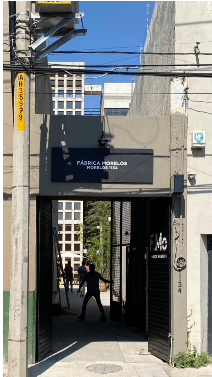
LETRERO PRINCIPAL Y LÁMPARA ARBOTANTE