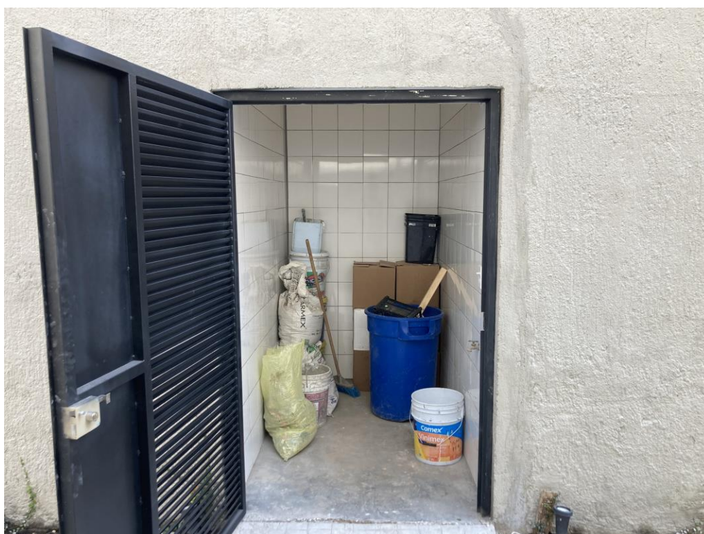
ESPACIO DE RECICLAJE